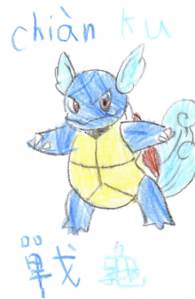
0008 戰龜 Chiàn ku