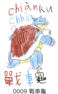
0009 戰車龜 Chiàn chhia ku