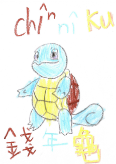
0007 錢年龜 Chīn nī ku