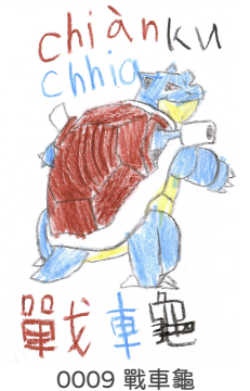
0009 戰車龜 Chiàn chhia ku